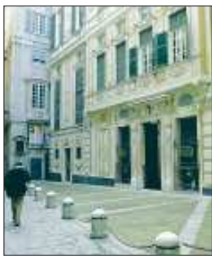
Palazzo Spinola di Pellicceria

NUOVO allestimento della sala didattica del museo di Palazzo Spinola, che dal 1996 è luogo delle diverse attività rivolte ai visitatori più giovani e alle scolaresche attraverso laboratori e incontri, alla luce dell'esperienza acquisita. È stata riprogettata, nell'atmosfera e negli arredi: qui si svolgeranno le attività proposte per gli alunni dei diversi ordini di scuola, dalla materna agli istituti scolastici di secondo grado. I bambini saranno accolti come fosse la camera del piccolo Ansaldo Pallavicino, che in età adulta divenne proprietario del Palazzo, e che i ragazzi possono conoscere attraverso i ritratti di Van Dyck e di Fiasella