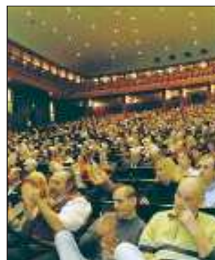
L'interno del Carlo Felice